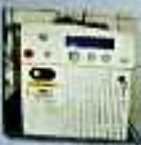
KTP 532 LASER