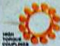
HIGH TORQUE COUPLERS