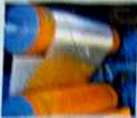
STEEL ROLLERS/MILL ROLLERS