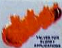
VALVES FOR SLURRY APPLICATIONS